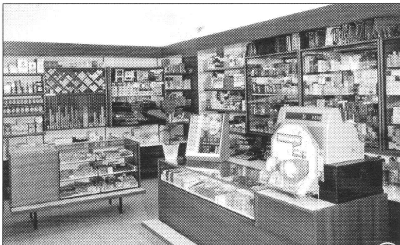
So sah die Filiale in den 60er-Jahren aus